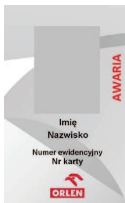
Karta dla pracownika ORLEN S.A