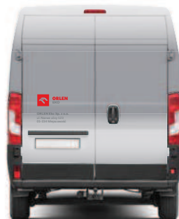
samochód dostawczy – tył