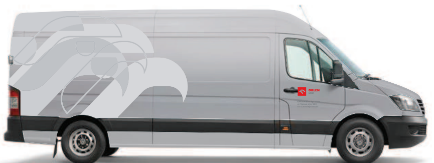
samochód dostawczy – prawy bok